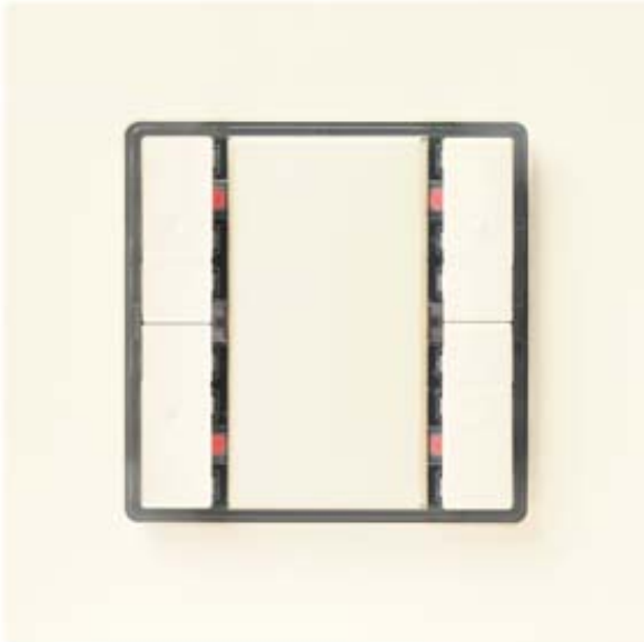
GAMMA INSTABUS TASTER 2-FACH, MIT LED UP 222/3 DELTA I-SYSTEM TITANWEISS